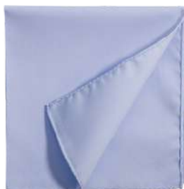
Pochette Coton unie bleu ciel II