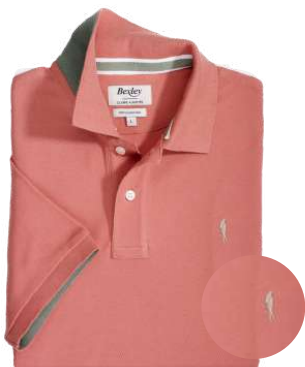
Andy II Rose Vintage