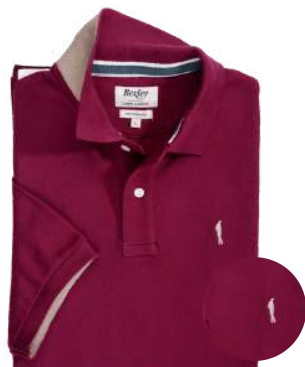
Andy II Lie de vin