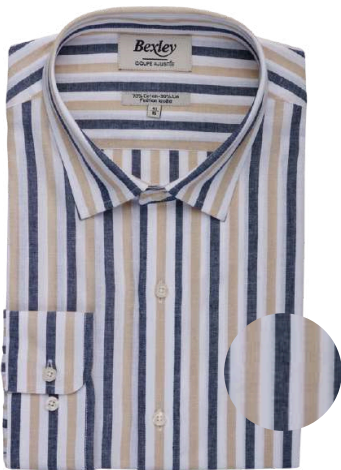
Simonin marine et beige foncé