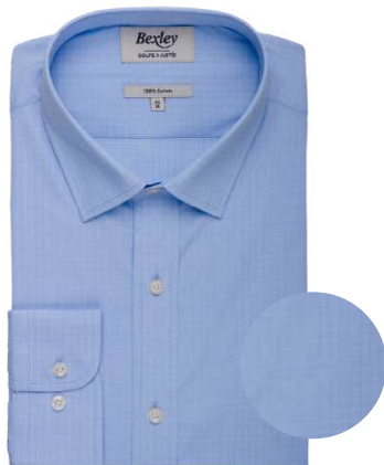
Marcilien bleu et blanc