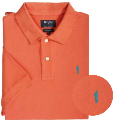
Gareth Orange foncé