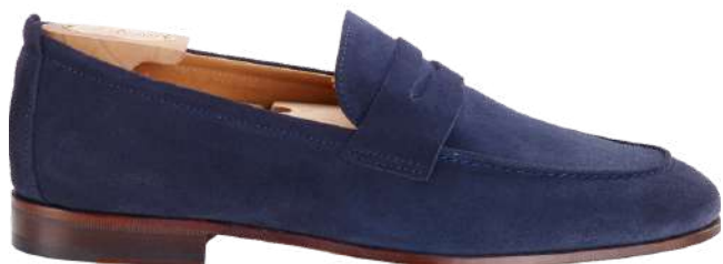
CEVIO Velours navy

Velours traité hydrofuge Doublure intégrale cuir de vachette Semelle cuir