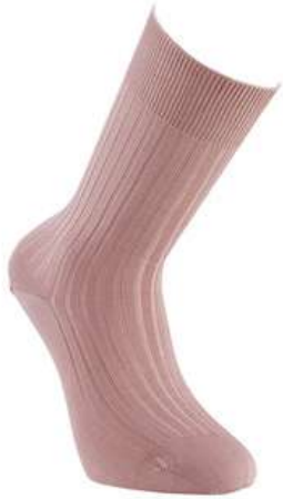
Chaussettes fils d'Ecosse vieux rose

CHAUSSETTES 8€ la paire - 25€ les 4 - 35€ les 7