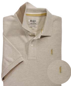
Andy II Beige chiné