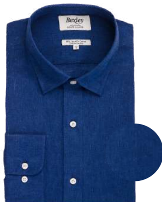
Silbert chambray indigo