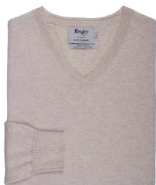
Beige clair chiné