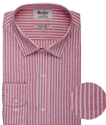
Edibert chambray vieux rose et blanc 70% coton 30% lin