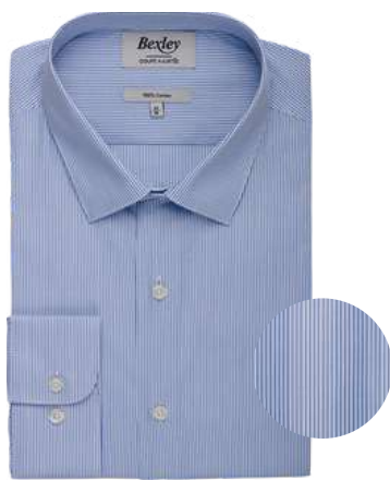
Andrien classic bleu ciel et blanc