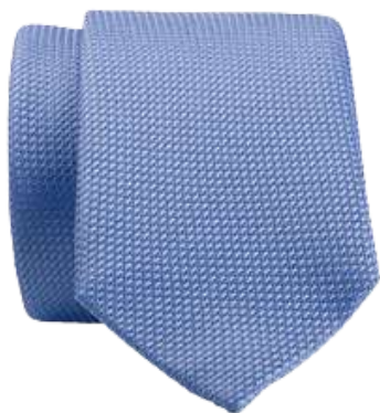
Cravate Soie Natté Unie bleu clair