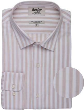
Simonin beige et blanc