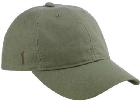
Lin vert sauge