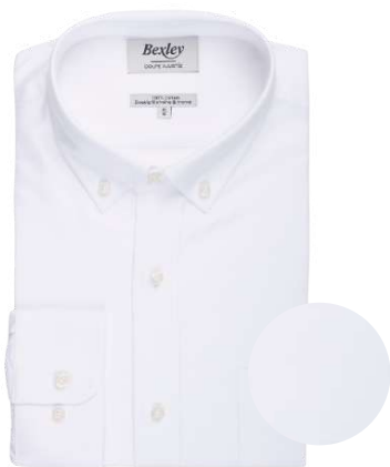
Bradford II blanc