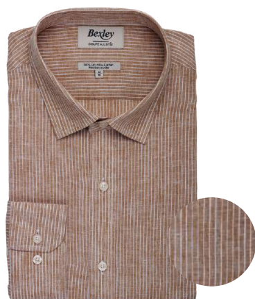
Edibert camel et liseré blanc 55% coton 45% lin