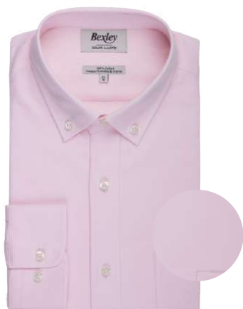
Bradford II rose pâle