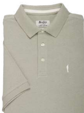
Adger Vert tilleul