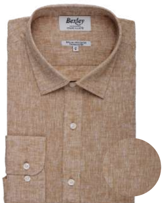
Silbert chambray havane