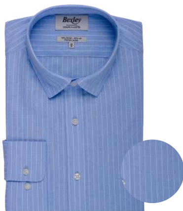
Edibert bleu clair liseré blanc II 70% coton 30% lin