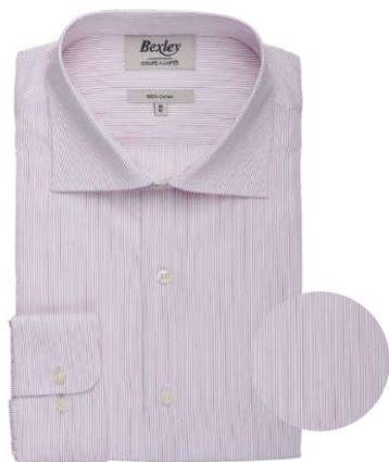
Santino blanc et rouge