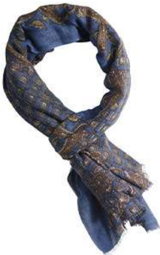
Chèche Lin Coton II bleu indigo motif taupe