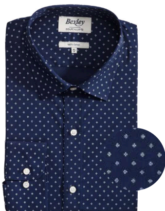
Alphide navy et blanc