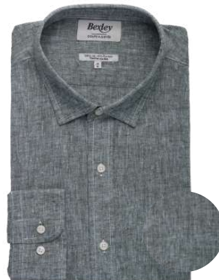
Silbert chambray vert foncé