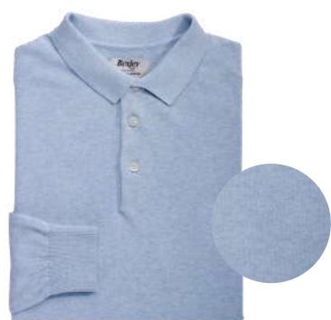
Bleu ciel chiné