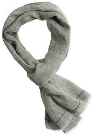
Chèche Lin Coton II Chambray vert bordure marine