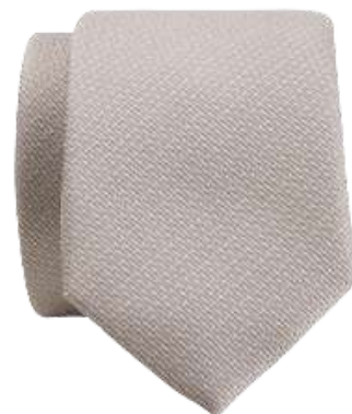
Cravate soie faux unie beige et blanc