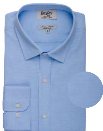
Theonel bleu ciel