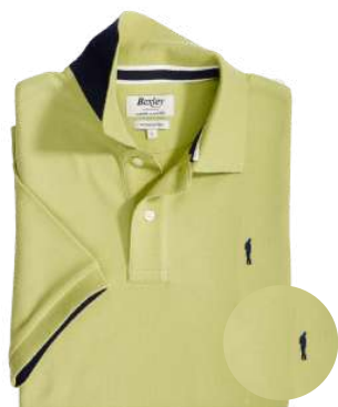
Andy II Vert pistache