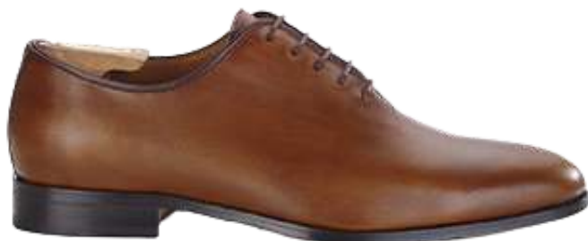
CORSTON Gold patiné

Cuir de veau italien patiné Doublure intégrale cuir de vachette Semelle cuir