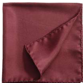
Pochette Soie unie bordeau