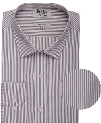
Maximilien taupe et blanc