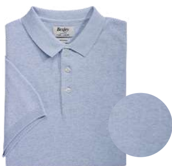
Bleu ciel chiné