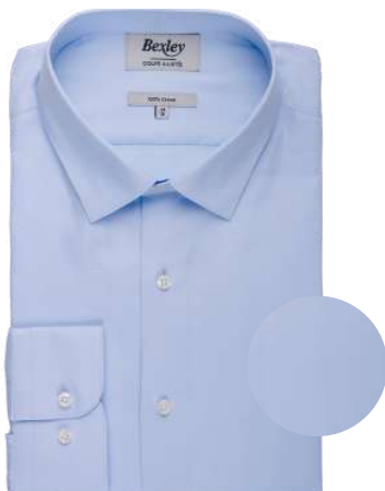
Ludvien classic bleu pâle