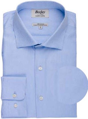
Savino bleu clair et blanc