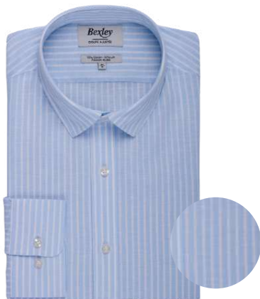
Edibert bleu pâle et blanc 70% coton 30% lin