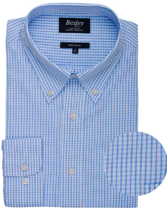
Glenn bleu clair et blanc