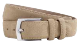
Westgate silver velours beige