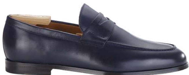
DERYBROOK Navy patiné

Velours traité hydrofuge Doublure intégrale cuir de vachette Semelle cuir