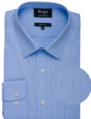
Berthod bleu et blanc