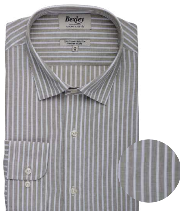
Edibert chambray tilleul et blanc 70% coton 30% lin