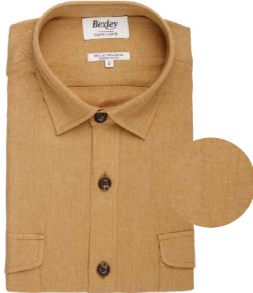
Corantin camel foncé