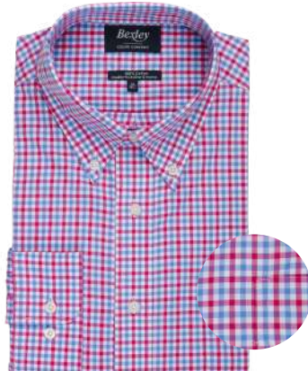
Cullen rose, bleu et blanc