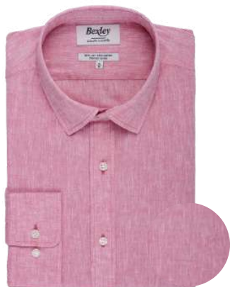
Silbert chambray vieux rose