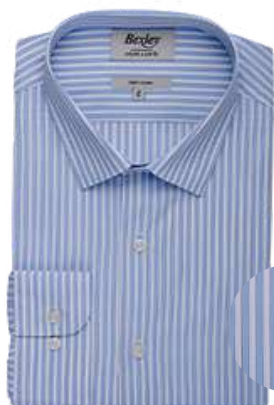
Leondre bleu ciel et blanc