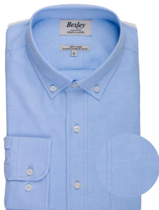
Bradford II bleu ciel