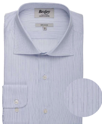
Santino blanc et navy