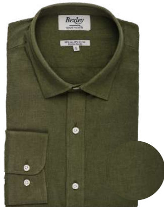
Silbert chambray vert forêt