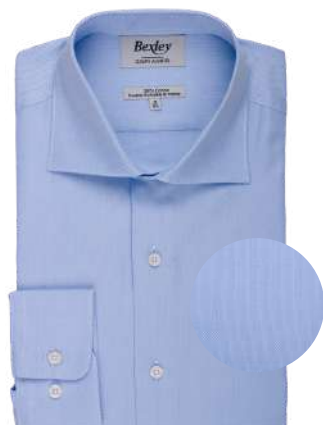
Ottavio classic bleu ciel