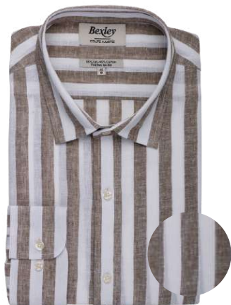
Brunien kaki et blanc