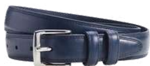
Brixton silver bleu patiné