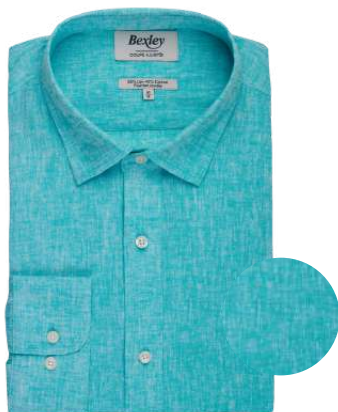
Silbert chambray vert menthe