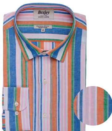
Edibert bleu orange et vert 70% coton 30% lin