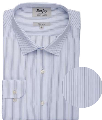
Clairemont blanc, navy et bleu