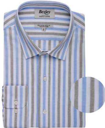
Simonin bleu ciel et vert sauge