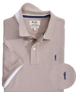
Andy II Greige