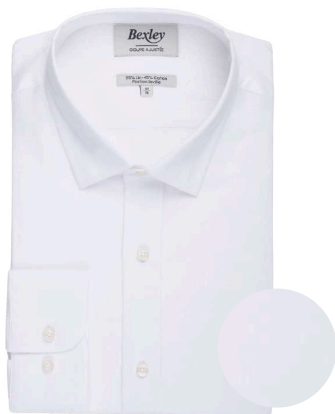
Silbert chambray blanc