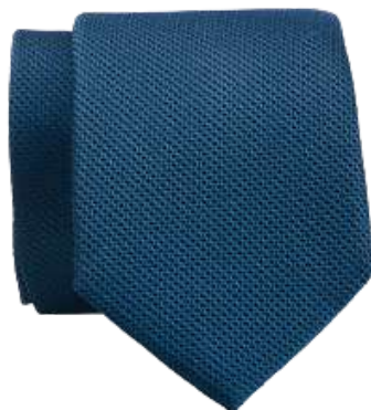
Cravate Soie Micro motif bleu et vert