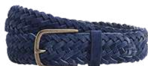
Northgate velours navy