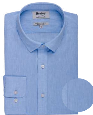
Silbert chambray bleu clair