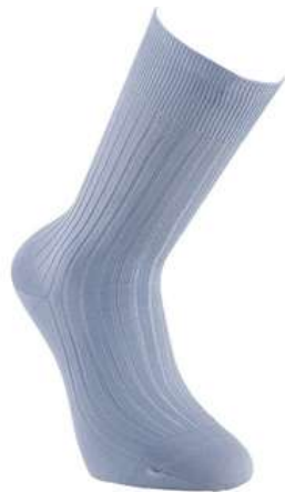
Chaussettes fils d'Ecosse bleu clair